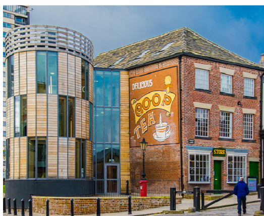
Le Musée des Équitables Pionniers de Rochdale au Royaume-Uni

Cette route sera composée par des entreprises coopératives dont les activités économiques: 1) sont profondément enracinées dans l'histoire et dans le territoire local et contribuent à préserver