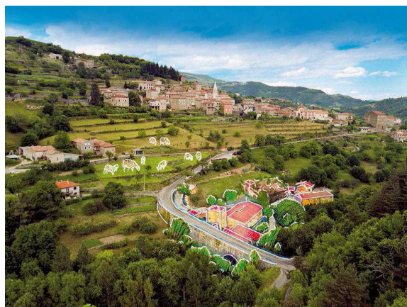
Ardelaine, Ardèche, France