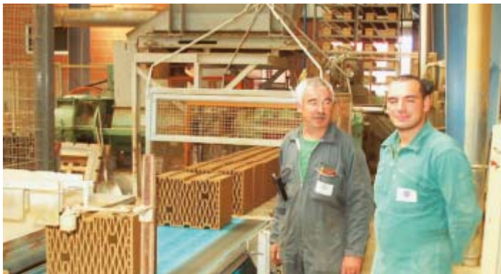
L'accompagnement vers le sociétariat est apprécié par le parrain et le filleul.